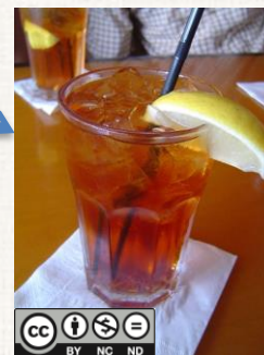
Un tè freddo