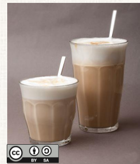
Un latte macchiato