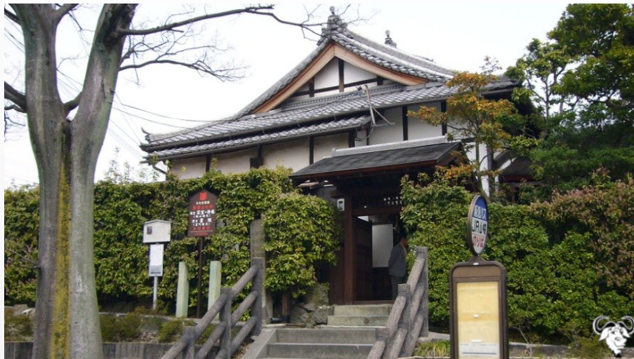
京都豐興山妙喜禪庵