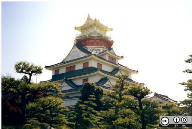
安土城模擬天守閣